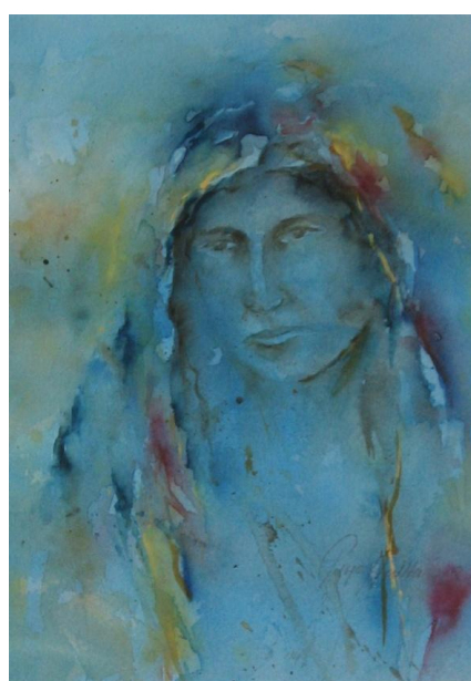
Sinisestä kirjasta, akvarelli, v. 2008