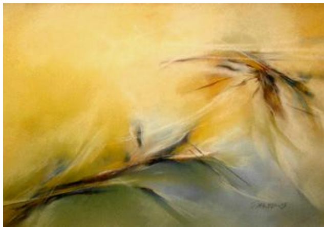
Kevät, pastelli, v. 2005

Flamencoaiheiset maalaukset tulevat usein oman harrastuksen kautta. Maalauksissa mielikuva voi olla itse koettu liike, tunnetila tai musiikki, joka on jossain vaiheessa koskettanut.