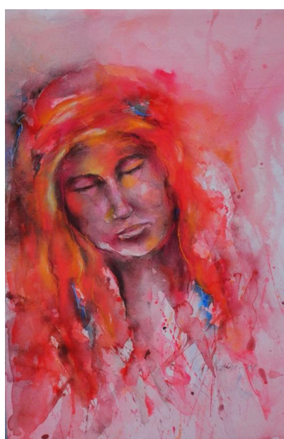
Uneksivan unia, akvarelli, v. 2008