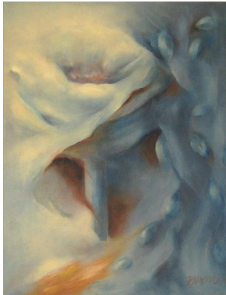
Sateinen päivä, öljy, v. 2010

Luonnonaiheet ja henkilöahmot rakentuvat maalauksien myötä. Teokset eivät kuitenkaan ole kuvia mistään tietyistä tai todellisista näkymistä, vaan häivähdyksiä mielenmaisemista sekä eletyistä ja koetuista aistikokemuksista.