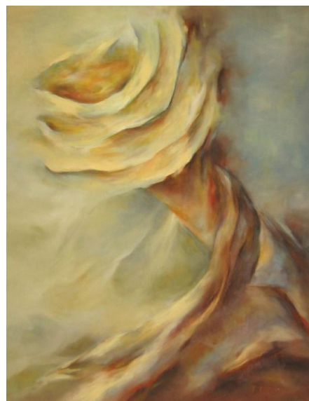
Puutarhurin päiväkirjasta II, öljy, v. 2010