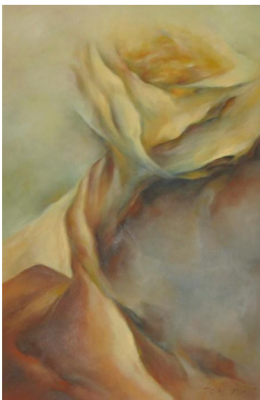
Puutarhurin päiväkirjasta I, öljy, v. 2010