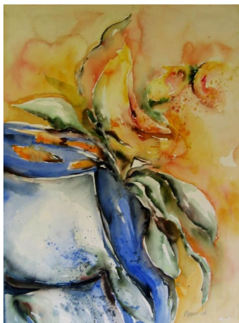
Mielenkuviota, akvarelli, v. 2008

Usein maalatessani ei ole mielikuvaa mihin pyrin. Akvarellimaalaukset syntyvät työn edessä, jollain tavalla intuitiivisesti. Tärkeää on valo, väri ja tunnelma.