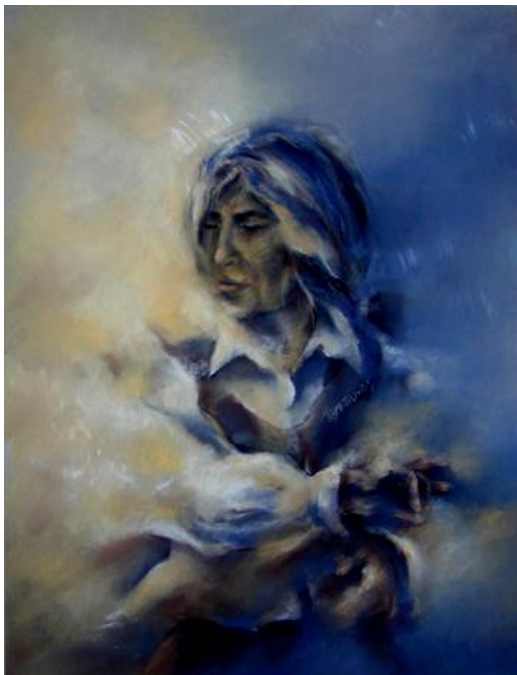
Farruca, pastelli, v. 2005